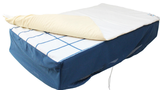
► Symmetrisleep borrelåslaken med Airmantle overmadrass

Det er et velprøvd system som er mye brukt for å beskytte og forbedre kroppsformen og funksjonen. For mange gir det avslapning, en bedre natts søvn og lettere pleie.