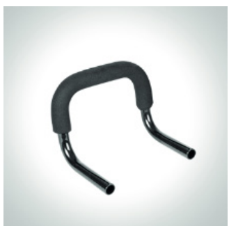
Kjørebøyle str. 1