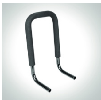
Kjørebøyle str. 2