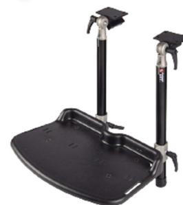
Fotplate - hel