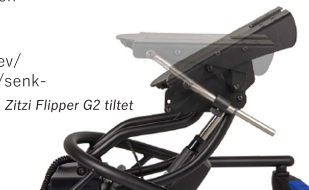
Zitzi Flipper G2 tiltet