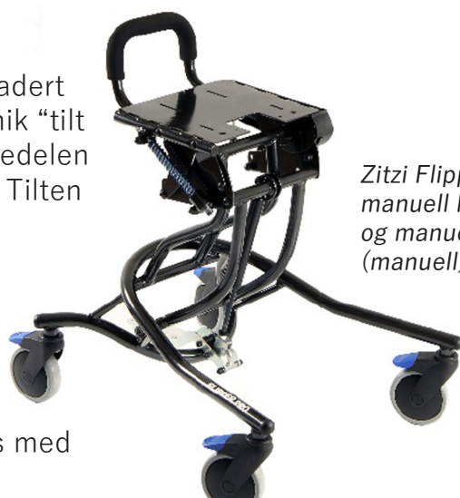
Zitzi Flipper G2 manuell hev/senk og manuell tilt (manuell)

Zitzi Flipper G2 passer sammen med støpeseter i myk,- og hardstøp fra Hjelpemiddelspesialisten, samt Zitzi Delfi Pro og Zitzi Sharky Pro.