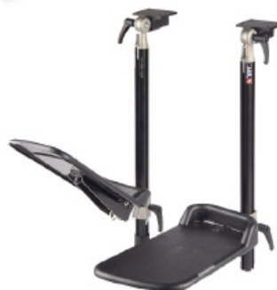
Fotplater - delt