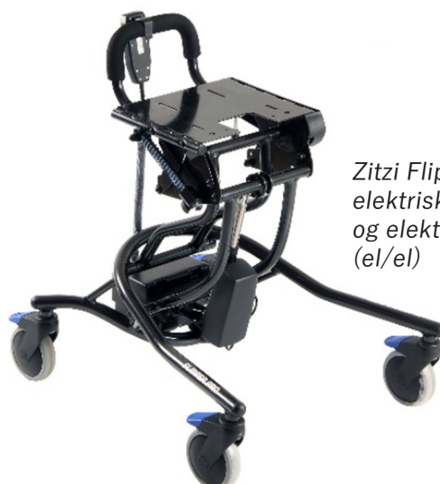
Zitzi Flipper G2 elektrisk hev/senk og elektrisk tilt (el/el)