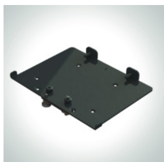
Festesystem til Delfi