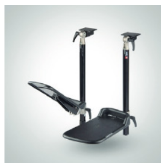
Fotstøtte - delt