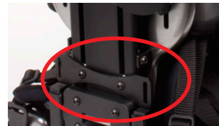
Monteringsforslag: Nedre monteringsbrakett Zitzi Delfi/Sharky Pro

CE-merket produkt i henhold til gjeldende EU-direktiver.