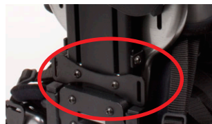
Monteringsforslag: Nedre monteringsbrakett Zitzi Delfi/Sharky Pro